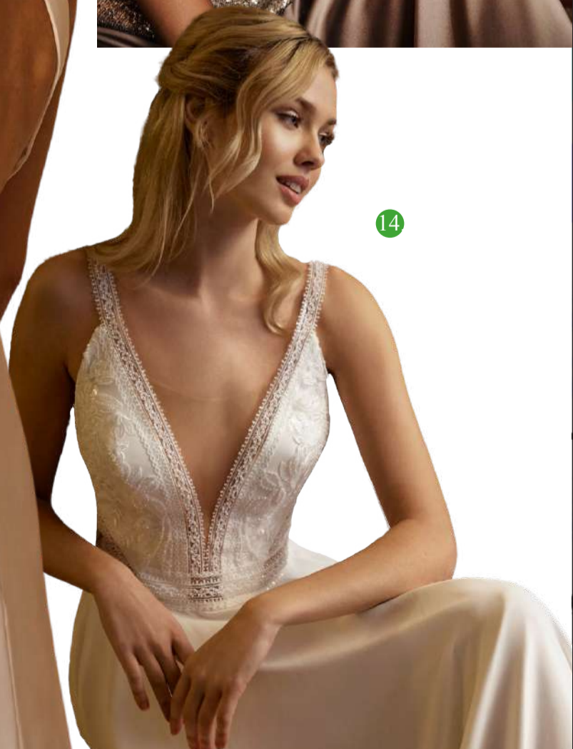
8. Carla 9. Rara Avis 10. Michela Ferrerio 11. B Bloomed 12. Elizabeth Passion 13. Joseph Ribkoff 14. Libelle Bridal