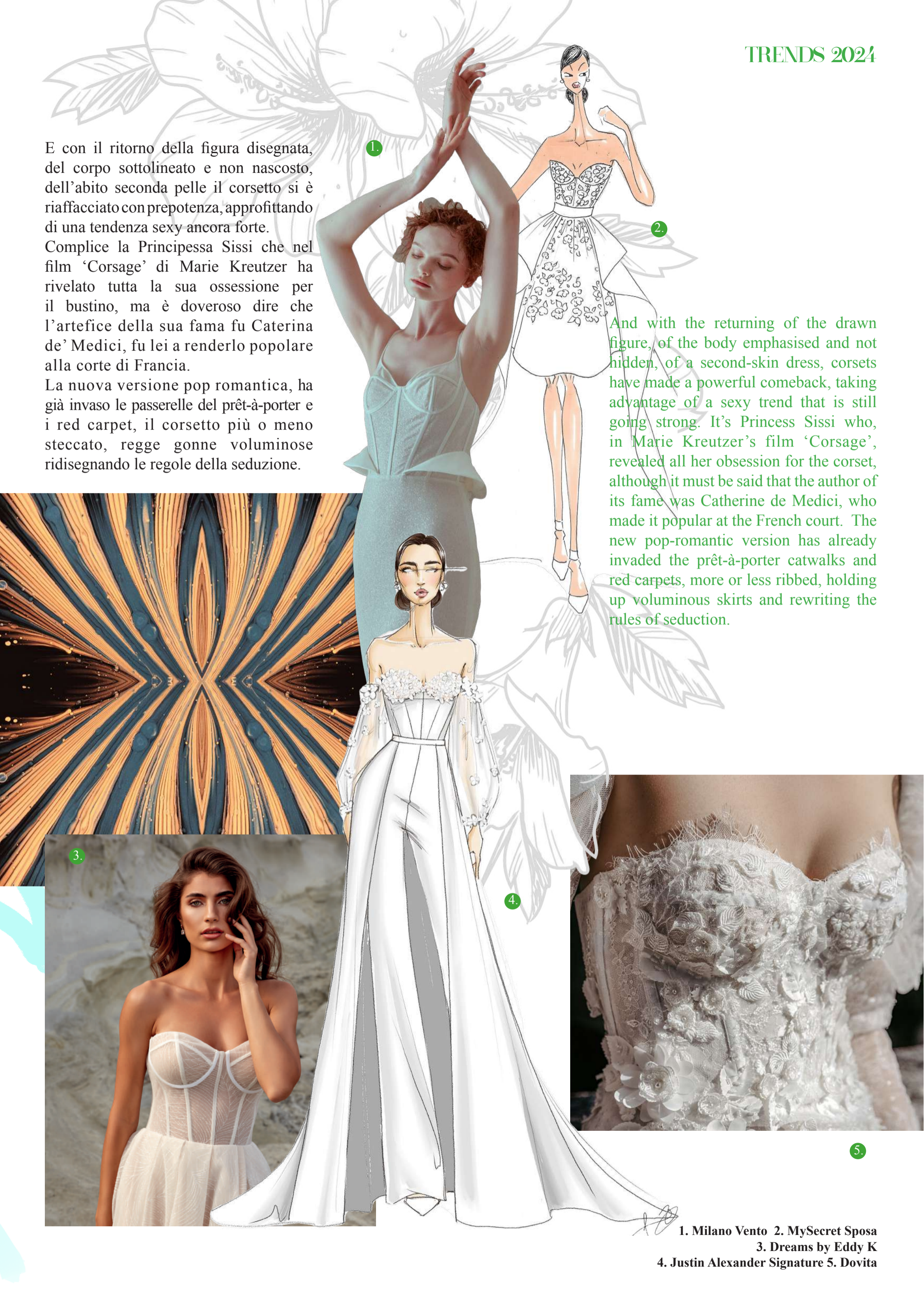
1. Milano Vento 2. MySecret Sposa 3. Dreams by Eddy K 4. Justin Alexander Signature 5. Dovita

And with the returning of the drawn figure, of the body emphasised and not hidden, of a second-skin dress, corsets have made a powerful comeback, taking advantage of a sexy trend that is still going strong. It's Princess Sissi who, in Marie Kreutzer's film 'Corsage', revealed all her obsession for the corset, although it must be said that the author of its fame was Catherine de Medici, who made it popular at the French court. The new pop-romantic version has already invaded the prêt-à-porter catwalks and red carpets, more or less ribbed, holding up voluminous skirts and rewriting the rules of seduction.